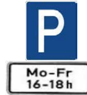
Parkplatz mit zeitlicher Begrenzung

Sie dürfen über die Park-Zeit hinaus parken.