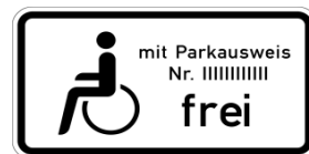
Rollstuhlfahrersymbol mit Parkausweis

Wenn Ihr Park-Ausweis eine andere Nummer hat. Dieser Behinderten-Parkplatz ist für einen bestimmten Menschen.